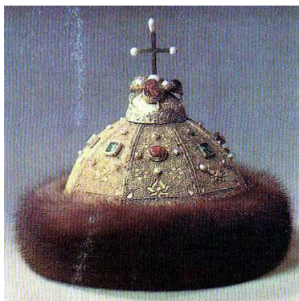
Самый древний венец русских царей – шапку Мономаха (XV век) украшают крупные самоцветы

И, конечно, многие из наших читателей посещали алмазный фонд в Московском Кремле и его Оружейную и Патриаршие палаты, бывали в Эрмитаже. Там бесценные драгоценные камни можно увидеть и в царских головных уборах (включая знаменитую шапку Мономаха) и в многочисленных украшениях, кубках, окладах икон.