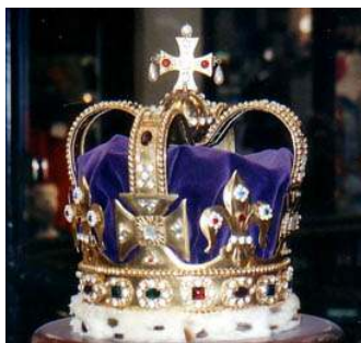
Копия имперской короны Великобритании в Queen Victoria Building. Можно представить какие самоцветы ее украшают.

Копии корон Ее Величества дают представление о том, сколько крупных алмазов, рубинов, сапфиров и изумрудов ушло на их изготовление.